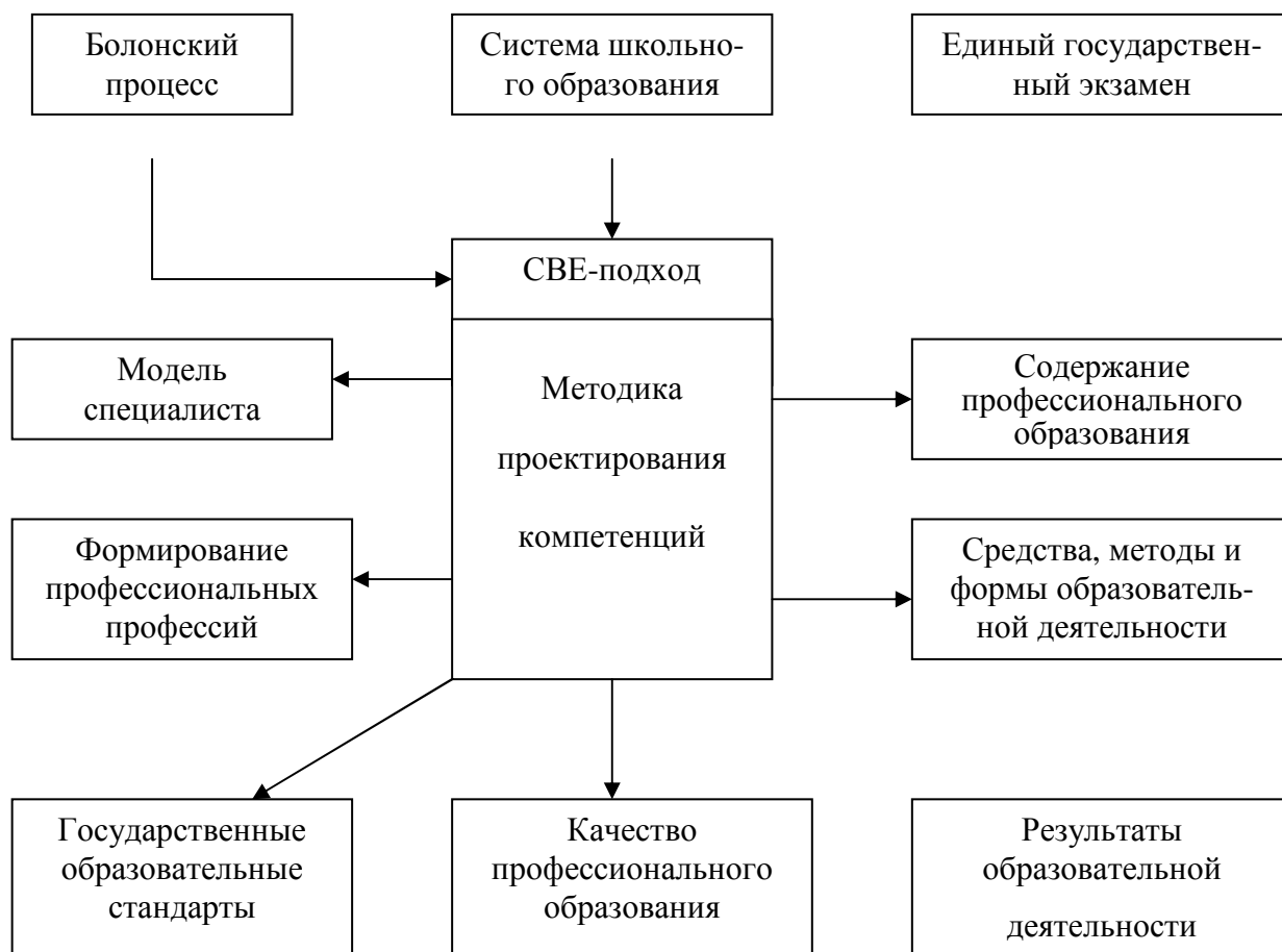
Рис. 1.4. Проблемные области реализации СВЕ-подхода