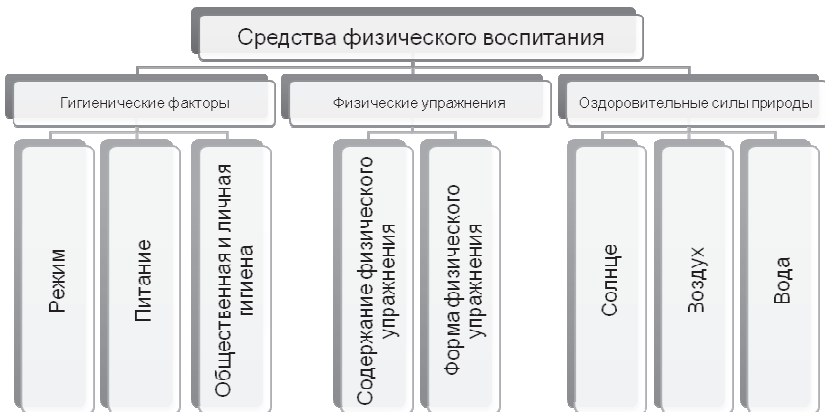
Рис.1. Средства физического воспитания