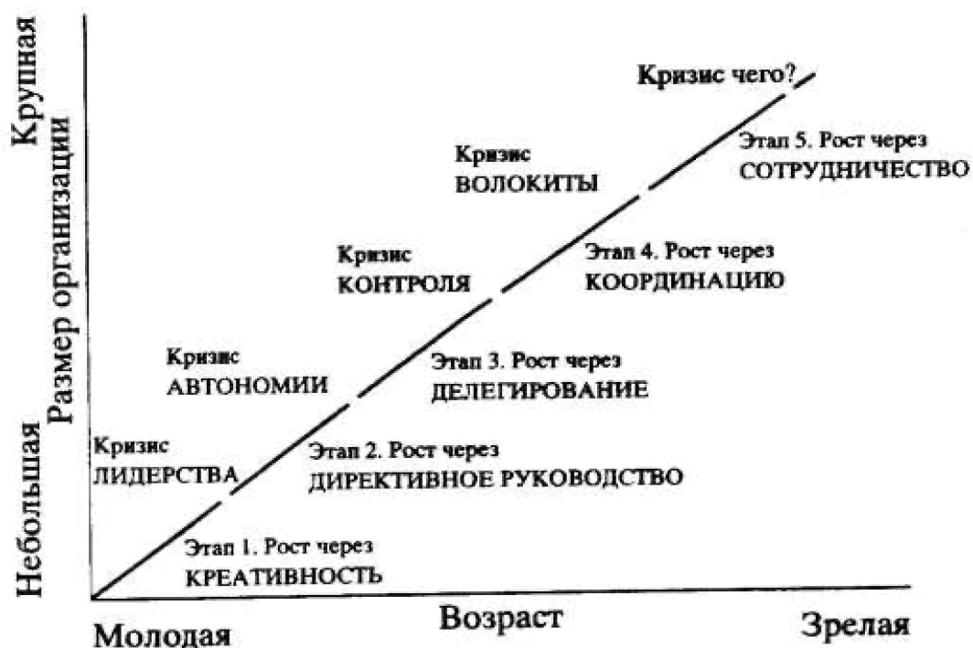
Рис.1. Стадии жизненного цикла и кризисы организации по Л.Грейнеру