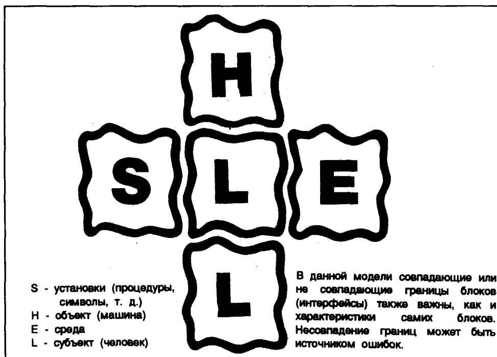
Рисунок 1-1. Модель SHEL

1.8 Субъект (или человек) находится в центре модели. Обычно он считается наиболее критическим, а также наиболее гибким составным элементом системы. И все же для людей характерны значительные различия в их рабочих характеристиках и масса ограничений, большинство из которых в настоящее время можно в общих чертах предвидеть. Границы этого блока имеют зазубрины, так что во избежание стрессовых ситуаций и конечного разрушения системы они должны иметь точное сопряжение с границами других блоков—элементов. Для достижения такого сопряжения очень важно понимание характеристик этого центрального элемента. Примерами таких важных характеристик являются: