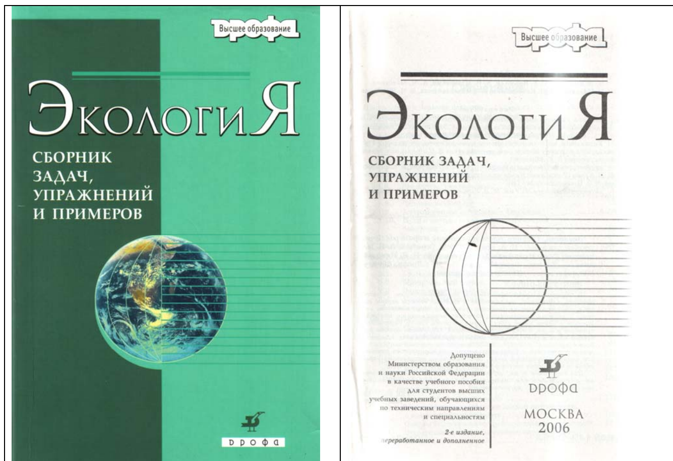
Рис. 1. Внешний вид обложки книги (слева) и первой страницы (справа)

«Допущено Министерством образования и науки Российской Федерации в качестве учебного пособия для студентов высших учебных заведений, обучающихся по техническим направлениям и специальностям».